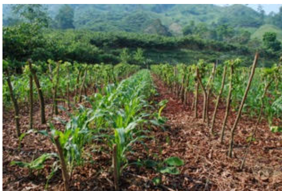
Majsplantor börjar komma upp.

Stiftelsen skapar en hållbar försörjning för jordbrukare och deras familjer genom att införa Inga Alley Cropping som ett hållbart alternativ till svedjebbruk. Omställningen gör det möjligt för småbrukare att få en stabil försörjning och förbättrad livskvalitet för sina familjer samtidigt som de kan behålla och/eller återbeskoga regnskogen och bevara dess mångfald. Svedjebbruk är en destruktiv metod, en av huvudorsakerna till skövlingen av kvarvarande regnskogar. Världen över använder 250-300 miljoner familjer svedjebbruk, en metod som inte ger utrymme för att ta sig ur fattigdom, men som hittills varit det enda sättet för dessa familjer att överleva. Svedjebbruket beräknas avge mer än en miljontals ton koldioxid per år till atmosfären. Genom Inga Alley Cropping kan utarmad mark återställas, långsiktig livsmedelssäkerhet skapas, regnskog skyddas och utsläpp av koldioxid undvikas.