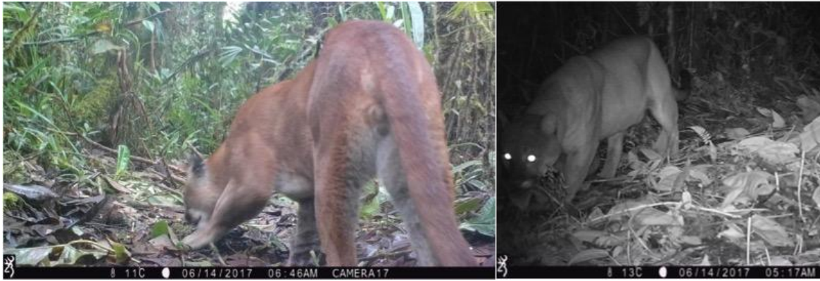
Pumor fångade i kamerafällor.