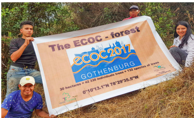
ECOC-skogen: Fundación Cambugan fick under 2017 ett bidrag motsvarande 30 hektar regnskog genom klimatkompensation från konferensen ECOC2017.

Tack vare stöd från Rädda Regnskog och Framtidsjorden startade år 2017 det femåriga projektet "Granja Agroecológica San Isidro", en länk mellan agroekologiska producenter och konsumenter, ungdomar, invånare och akademien för att främja en bättre livskvalitet i en hälsosam miljö och förbättrad motståndskraft mot klimatförändringar. Den främsta prestationen i år var utbyte av erfarenheter mellan bondeorganisationer i kommundelarna Píntag, San Jose de Minas och Fundación Cambugán. Utbytena har främst gällt praktiska erfarenheter av alternativa, produktiva och hållbara metoder som gör det möjligt att leva med bättre balans med naturen och bevarande av skogen. La Granja Agroecológica San Isidro (gården i Píntag) utvecklas till ett centrum för utbildning och kulturella utbyten, agroekologisk produktion samt återhämtning av den inhemska floran och faunan. Dessutom är gården en plats för kommersialiseringen av de produkter som producenterna i Cambugáns nätverk i San Isidro, Píntag odlar och framställer.