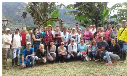
Studieresa och gastronomisk festival.