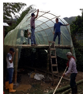
Rötningskammare, vedspis och tält installerade.

Samarbetet innebär bl.a. att tre mindre rötningskammare för behandling av organiskt material har installerats. Rötningskamrarna producerar biogas som används för bränsle och rötrest som används som gödsel. Serraniagua har tecknat ett samarbetsavtal med Tolimas universitet som innebär att universitetet installerar anläggningarna. Ett växthus har också installerats för att kunna soltorka kaffet. Det har även installerats två effektiva vedspisar som förbättrar kvinnornas livsvillkor eftersom det effektiviserar både ved och bränsle vid användning.