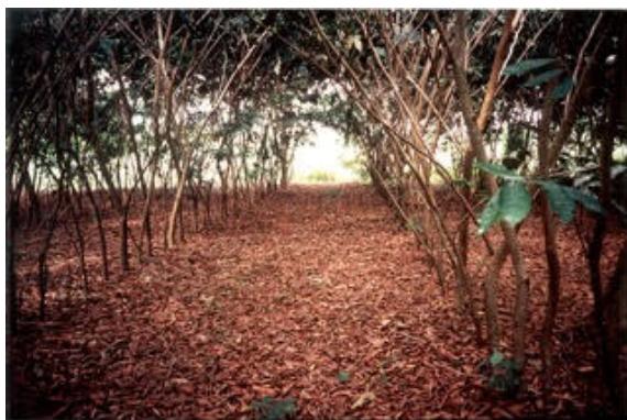
Här har allén slutit sig och skuggat ut ogräset. plantering