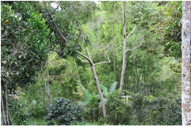
Kaffefarm i reservatet Vereda San José.

Serraniagua har startat ett samarbete med 8 gårdar som ingår i Colombias världsarv för den kulturella kafferegionen. Dessa gårdar arbetar med kaffeodling anpassade till inhemska skogar som är viktiga för avifauna och i synnerhet för flyttfåglar.