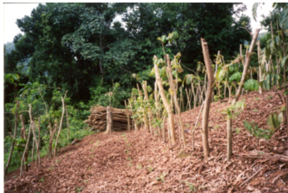
Beskärningen utförd och löven lagts på som täckning, klart för