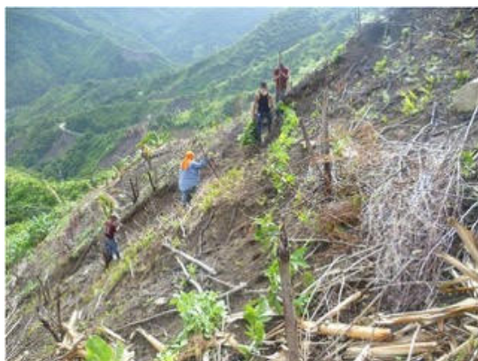
Plantering av Inga-träd.