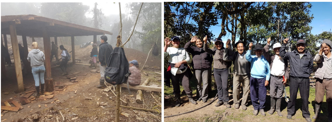
Stugbygge i Cambugánskogen.