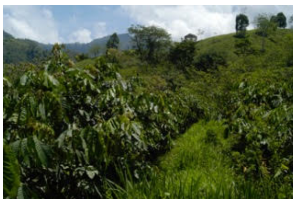
Inga-träd på tillväxt.