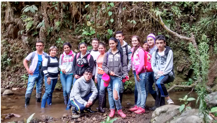
Deltagare i en av de miljöutbildningar som hållits