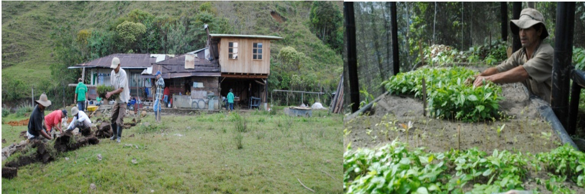
Odling samt restaurering av skog med inhemska träd.