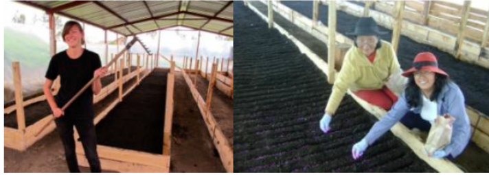
T.v. Pilotgården Pintaq ligger ca 100 sydost om Quito. T.h. Arbete med starta den ekologiska är i fullgång

Fundacion Cambugán presenterade en slutrapport i augusti 2015. Några av de uppnådda resultaten presenteras här: