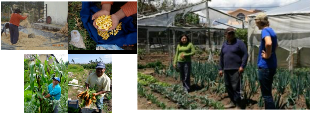
Pilotgården och den ekologiska matproduktionen är nu igång