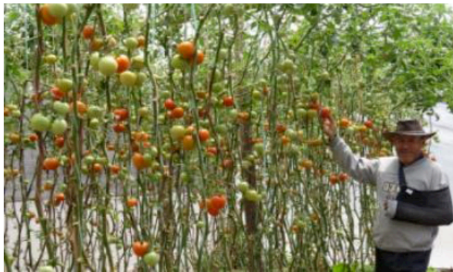
Segundo Morales är en av de personer som har startat egen produktion av ekologisk mat.