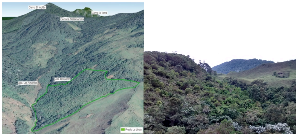
T.v. Området som köptes under projektet (ljusgrön linje)