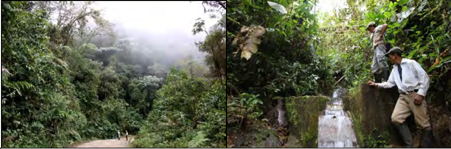
T. v. Skogsområdet i samhället El Pacifico vars inköp pågår just nu. T. h. Invånarna i området som föreningen Serraniagua köper in med Rädda Regnskogs stöd är helt beroende av vattnet från skogen.