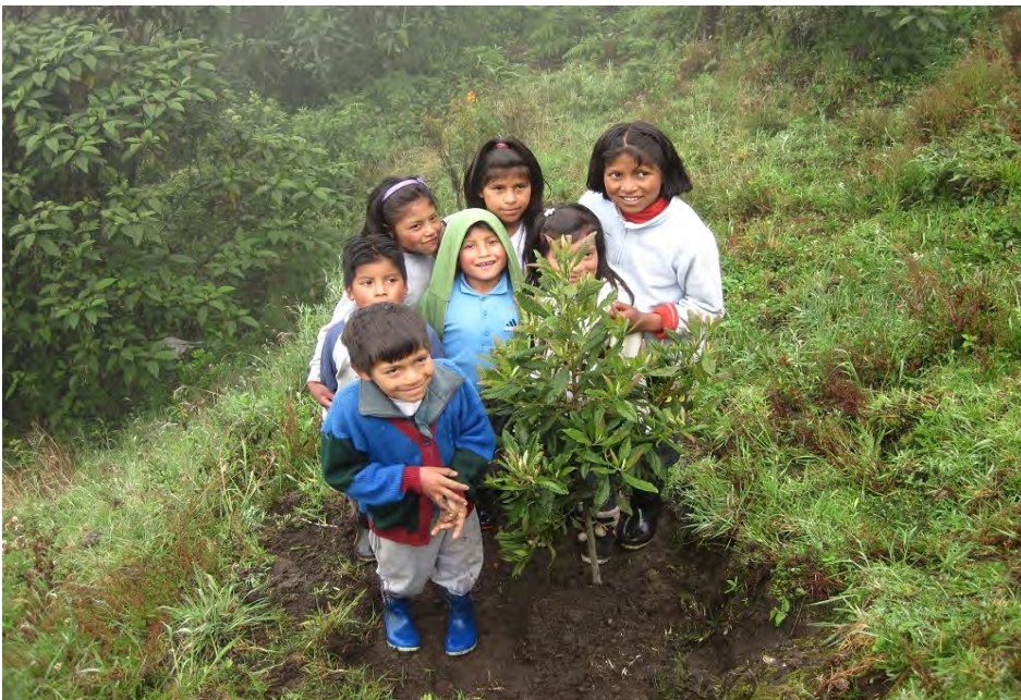
Bilden är tagen vid besök till San Francisco i Ecuador där Stiftelsen Cambugán har startat ett projekt för återplantering av träd i anslutning till ett skolområde där barnen ett väldigt engagerade i projektet.

Efter att föreningen i Serraniagua har inlämnat en slutredovisning som Rädda Regnskogs styrelse kan godkänna planeras för nytt projekt baserat på samma mål som beskrivs ovan.